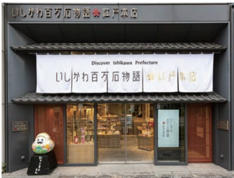
【店舗概要】 店舗名称:石川県アンテナショップ「いしかわ百万石物語・江戸本店」 所在地:〒104-0061 東京都中央区銀座2-2-18 TH銀座ビル TEL:03-5579-5890 FAX:03-5579-5892 E-Mail: ishi-edohonten@cpl-tokyo.jp 営業時間: 営業時間変更11:00~19:00

3月6日(金)新たにリニューアルオープンした石川県アンテナショップ「いしかわ百万石物語・江戸本店」は店舗内外での様々なイベントや商談会の開催、県内事業者の販路開拓支援などアンテナショップの役割を充実させるため、地元石川県の企業である株式会社シ・ピ・エル(県人会法人会員)が管理運営会社となりました。 いしかわの魅力を体験できる様々なワークショップや事業者のPRイベント等を開催します。 観光案内カウンターでは、専任の観光コンシェルジュが観光地や食やイベントなど、魅力たっぷりの石川の情報をきめ細かくご案内します。石川への旅行のご相談にも応じています。 また、店内約900アイテムの約300アイテムがアンテナショップ初お目見えの商品となっています。今回のリニューアルコンセプトにあわせ、店舗にて販売する商品を大幅に見直し、意欲のある事業者を中心に、新たな販路拡大を図るための支援やテストマーケティングを積極的に展開します。