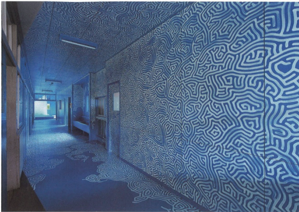
2021の作品/山本基「記憶への回廊」